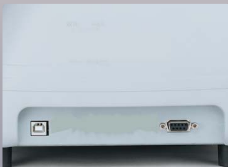
USB High-Speed Interface